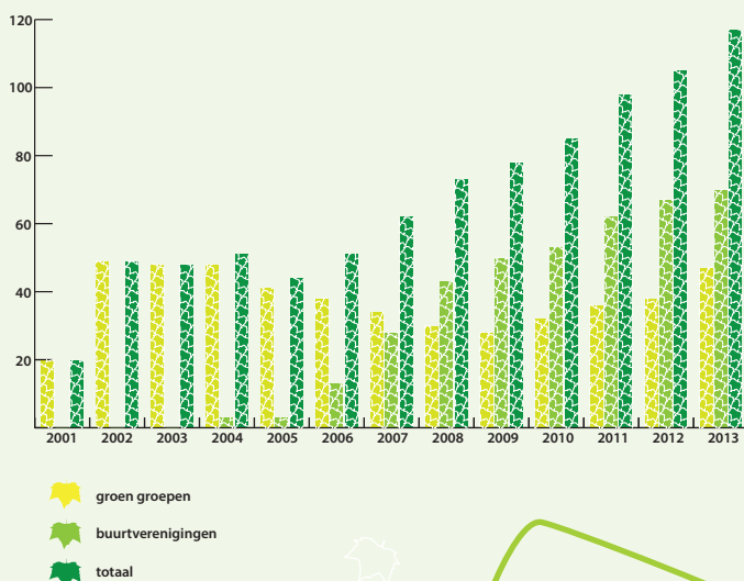
Bij TGE aangesloten groepen